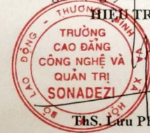
ThS. Lưu Phước Dũng