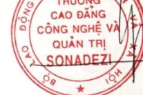
ThS. Lưu Phước Dũng