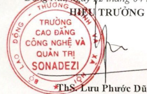
ThS. Lưu Phước Dũng